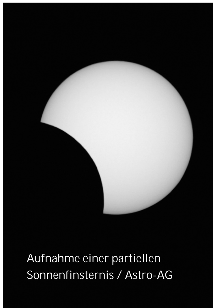
Aufnahme einer partiellen Sonnenfinsternis

Achtung, bitte niemals direkt mit bloßem Auge, Fernglas oder Fernrohr in die Sonne schauen – im schlimmsten Fall droht Erblindungsgefahr!